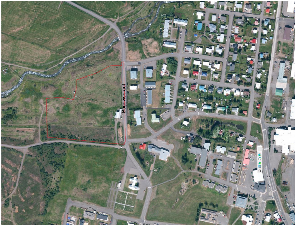
Mynd 1. Afmörkun skipulagssvæðis.